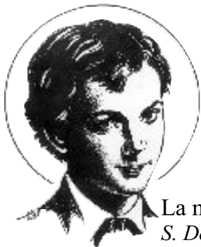
La mort, mais pas le péché. S. Dominique Savio