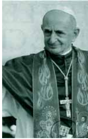
Giovanni Battista Montini, avec le fameux Éphod sous la croix pectorale

La mère de Montini fut ensuite élevée chez les Sœurs Marcelline, jusqu'à l'âge de 19 ans.