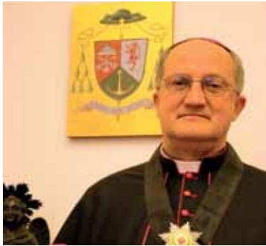
Mgr Enrico Del Covolo, recteur de l'Université du Latran