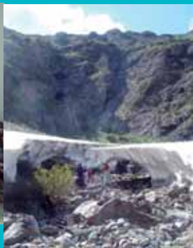
Camp des filles dans le Dauphiné : promenade au pied des glaciers