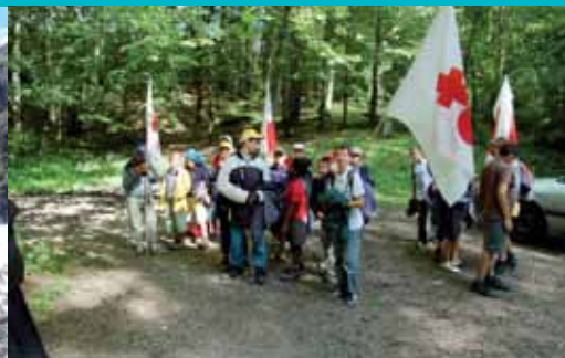
Camp de Raveau : les enfants dans la forêt