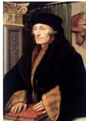
Érasme de Rotterdam

Cependant les réformes ne sont que la cause immédiate. Elles ne sont que l'application, l'entrée dans la réalité, des théories des pédagogues. Ces théories sont la principale explication, la vraie cause. Et c'est pourquoi il importe de les connaître. Nous commencerons par Érasme né en 1467. Après lui, nous passerons en revue treize pédagogues des siècles suivants. Le dernier que nous examinerons, Philippe Meirieu, est né en 1949... Certes, pendant longtemps, les théories d'Érasme et de ses successeurs n'ont pas été appliquées. On les admirait parfois,