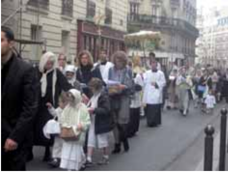
Première procession de la Fête-Dieu à Paris (juin 2012)

l'Île de France, en intensifiant tant les célébrations dominicales, que celles des jours fériés. Cela, en dépit des difficultés, à partir de l'automne 2012, dues à une nouvelle organisation interne décidée par les propriétaires de la salle de la Rue Bleue, à qui nous louions depuis presque sept ans. Un tournant important, donc, pour notre apostolat à Paris, qui nous a contraints à célébrer plusieurs messes les jours fériés dans notre oratoire de la rue Deck et à renoncer aux confirmations et au congrès annuel. Allant au-delà des limites temporelles que nous nous sommes fixées dans cette rubrique, nous pouvons anticiper que, au moment où nous écrivons (mars 2013), nous avons trouvé une nouvelle salle pour les célébrations pour les jours fériés (Paris X ème ). De 2012 rappelons en particulier la première procession des Rameaux et par ailleurs la première procession pour la Fête-Dieu dans les rues du XV ème arrondissement.