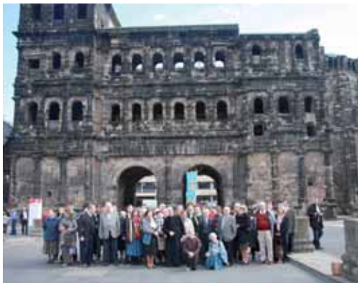
Pèlerinage à Trèves (avril 2012)

Nous avons déjà parlé de "l'affaire Giacobazzi", soulevée par la communauté juive de Milan et par une photo de Repubblica (6 mars) ; plusieurs sites en ont parlé, parmi lesquels Fascinazione du 6 mars 2012.