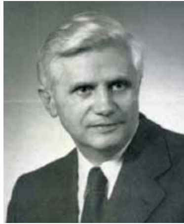
L'abbé Joseph Ratzinger, jeune professeur...

en dernière analyse il sera toujours incertain en face du problème de la foi. C'est dans le refus de la foi qu'apparaît l'impossibilité du refus de la foi" (pp. 11-12). La foi, donc, est pour Ratzinger incertitude, mais la non croyance aussi est incertitude ; pareillement, la foi n'a pas de preuves, mais le refus de la foi n'a pas non plus de preuves qui démontre que la foi est fausse : en ce sens la foi est "irréfutable". Croyance et non croyance, dans la pensée de Ratzinger, sont dominées par le doute.