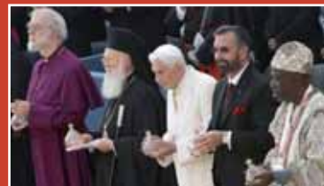
Ratzinger a démissionné (ici à Assise en 2011 avec les leaders des fausses religions), maintenant il y a Bergoglio mais l'œcuménisme continue... comme avant... plus qu'avant