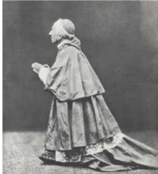
Léon XIII (sur cette photo alors qu'il était encore cardinal) publia l'encyclique Rerum Novarum sur la question sociale

'pour travail fait' plutôt que du salaire 'fixe', et paiement d'une partie du salaire de manière indirecte (au moyen de logements gratuits, versements pour assurances retraite, etc.) ; institution de parts additionnelles de salaires, à titre de participation aux bénéfices, devant être versées au moyen de primes annuelles dans les années favorables... construction de maisons ouvrières ; diffusion des organismes de bienfaisance ; institution de banques populaires" (7) .