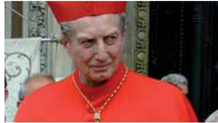
Le "cardinal" Carlo Maria Martini

C'est depuis novembre 2011, dans les congrès de Milan et de Paris, et ensuite dans le n° 64 de Sodalitium , d'avril 2012, que je parle – au risque d'ennuyer – de l'agnosticisme dans la pensée de J. Ratzinger. Paroles et écrits qui n'ont pas trouvé le moindre écho. Pourtant, quand les mêmes idées et initiatives sont attribuables non (directement) à Benoît XVI, mais, par exemple, aux cardinaux Martini (décédé récemment) et Ravasi, alors, et seulement alors, les voix et les plumes de certains écrivains catholiques sortent du silence et condamnent la "théologie du doute", attribuée aux deux cardinaux . Récemment, à l'occasion de la mort du cardinal Martini, et à l'initiative de Ravasi, a eu lieu à nouveau à Assise, le 5 octobre 2012, un rassemblement composé d'un groupe nourri de non ou peu croyants italiens, avec à leur tête le