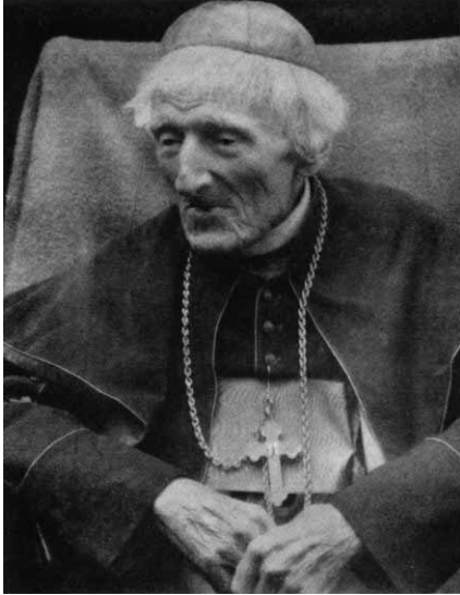
Le cardinal Newman