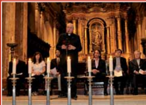
12 novembre 2012, dans la cathédrale de Buenos Aires, Bergoglio avec le patronage du B'nai B'rith commémore la nuit de cristal avec les représentants des juifs, des méthodistes, des luthériens (les six cierges allumés représentent les six millions de juifs de la shoah...)