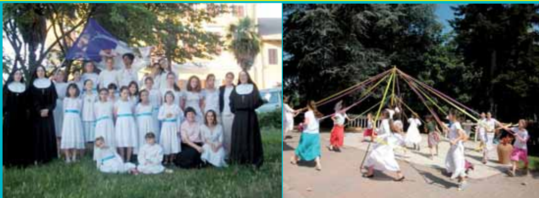
Activités de la Croisade Eucharistique et camp pour les fillettes et jeunes filles

22 juin petite retraite pour une première communion. Et encore, après l'été : camp sur le Cervin les 3 et 4 septembre, retraite du 31 octobre au 4 novembre avec excursion au San Carlone de Arona et visite des Îles du Lac Majeur ; récollection du 7 au 9 décembre avec procession en l'honneur de l'Immaculée (garçons et filles) ; du 21 au 25 décembre : retraite de préparation à Noël avec visite au Sacro Monte de Belmonte.