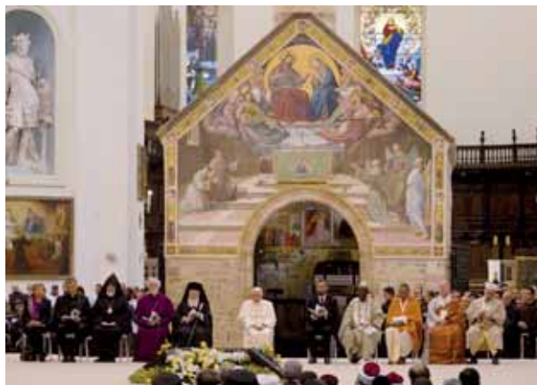
La réunion œcuménique d'Assise de 2011