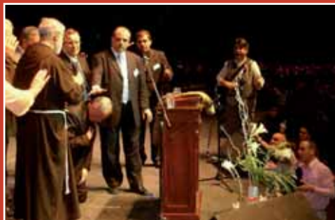
Buenos Aires, jeudi 22 juin 2006 à l'occasion de la III ème Rencontre Fraternelle de la Communion Rénovée des Évangéliques et Catholiques dans l'Esprit (CRECES). Le cardinal Bergoglio reçoit à genoux l'imposition des mains des pasteurs, prêtres et laïcs qui ont animé la rencontre...