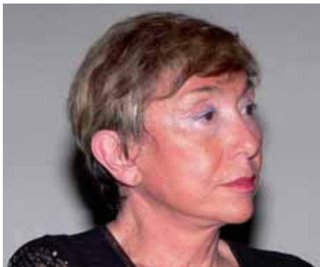
La psychanalyste athée Julia Kristeva