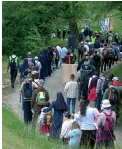
Pèlerinages : au-dessus : Osimo-Lorette au-dessous : N.-D. de l'Osier.