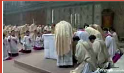
Première "messe" dans la chapelle Sixtine avec la table à la place de l'autel : à la "consécration du Pain et du Vin", les deux fois, Bergoglio et tous les cardinaux présents se contentent de s'incliner, sans s'agenouiller, alors que les servants autour de lui sont agenouillés...