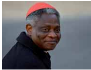
Le “cardinal” Peter Kodwo Appiah Turk- son