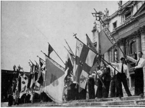
Délégations ouvrières à Rome pour le 60 ème anniversaire de Rerum Novarum (15 mai 1951)

production et la répartition de la richesse dans le but d'assurer la subsistance de l'homme, non seulement selon le strict devoir (justice) et le strict besoin (subsistance), mais aussi selon la civilisation morale (charité, philanthropie) et matérielle (aisance). Par conséquent, il y a deux pivots éthico-juridiques de l'économie sociale – la justice et la charité ; comme il y a également deux faits matériels auxquels pourvoir – la subsistance et l' aisance » (13).