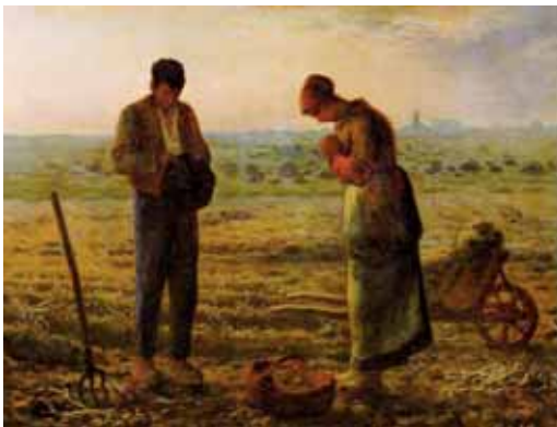
Paysans récitant l'Angélus (œuvre de Jean-François Millet)