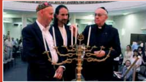
13 décembre 2012, Bergoglio à la synagogue du temple NCI-Emanu El de la "Fundación Judaica", en compagnie du rabbin "progressiste" Sergio Bergman