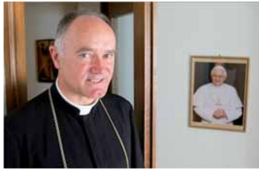
Mgr Bernard Fellay, Supérieur Général de la FSSPX

L’histoire de la Fraternité, dit un jour Mgr Lefebvre, est l’histoire de ses schismes. La cause principale de ces schismes, arrivés désormais aux sommets de cette société,