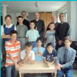
Camp en Belgique : photo de groupe