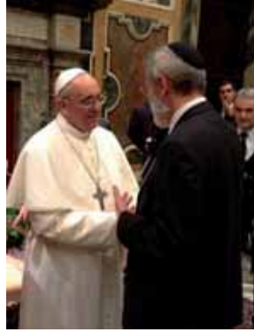
J. Bergoglio recevant Riccardo Di Segni, grand rabbin de Rome. À l'occasion de la fête de Pessa'h, il a adressé ses vœux à l'ensemble de la communauté juive...

C'est par un simple acte de renonciation de sa volonté que Joseph Ratzinger a refusé l'élection qui avait été faite en sa personne, rendant ainsi le Siègre totalement vacant ; il a ainsi rendu explicite l'absence chez lui de la volonté de gouverner