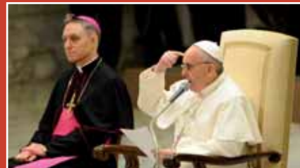
Parlant aux journalistes, il ne les a pas bénis par ces mots: "Je vous avais dit que je vous aurais donné de grand cœur ma bénédiction. Etant donné que beaucoup d'entre vous n'appartiennent pas à l'Église catholique, d'autres ne sont pas croyants, j'adresse de tout cœur cette bénédiction, en silence, à chacun de vous, respectant la conscience de chacun, mais sachant que chacun de vous est enfant de Dieu. Que Dieu vous bénisse".